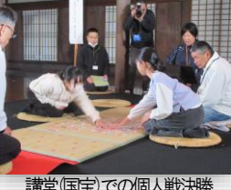
講堂(国宝)での個人戦決勝